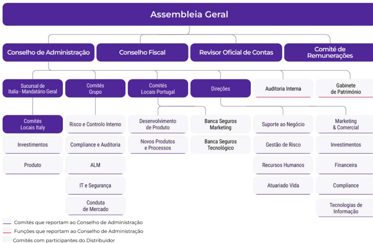
Figura 1 – Organograma da GamaLife

A atual estrutura organizacional da GamaLife - Companhia de Seguros de Vida, S.A. em Portugal e Itália é a apresentada através do organograma abaixo: